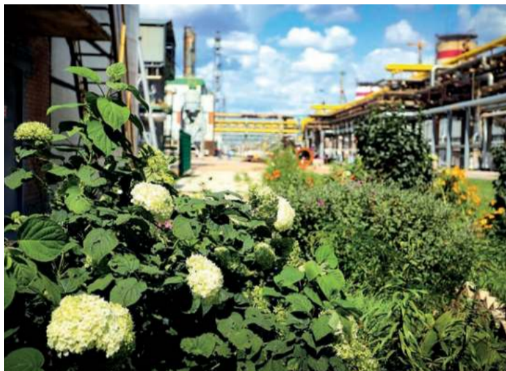
Пышные гортензии возле агрегата аммиака №5 поднимают настроение сотрудникам. А, значит, повышают производительность.

Летом ТООЗ буквально расцветает: коллективы цехов создают и поддерживают красоту на всей промплощадке. В фотообъективе Ольги Волокушиной – самые яркие цветочные клумбы завода.