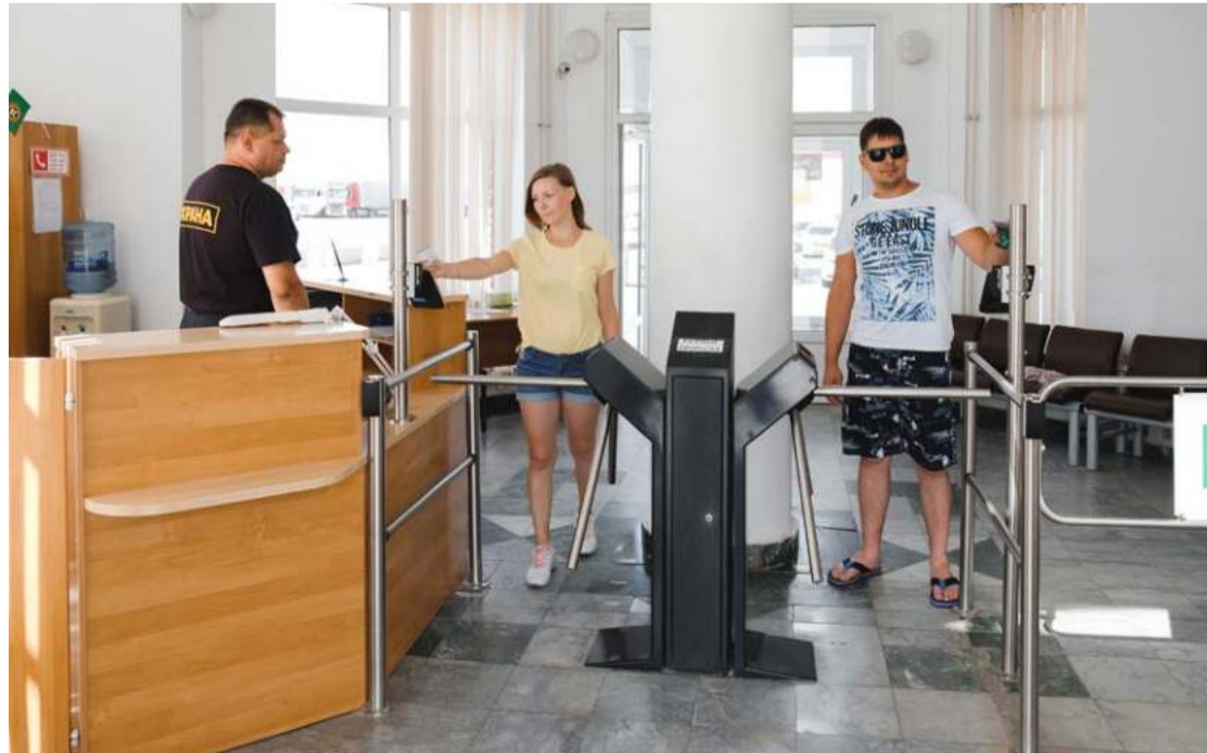
Из рабочего гардероба, в первую очередь, нужно исключить сланцы, каблуки-шпильки, шорты, бриджи, слишком короткие юбки, платье с глубоким декольте. Ваш внешний вид должен быть опрятным и уместным, а прежде всего, безопасным!

– Тоазовцы начали забывать о деловом стиле и общем имидже. Мы понимаем, что в солнцепёк хочется носить открытые вещи. Но призываем придерживаться более сдержанного стиля одежды, который прописан в положении о корпоративном дресс-коде. Это вопрос безопасности и образа сотрудника крупной компании, – отметила она. – В документе подробно обозначены обязательные и рекомендательные пункты, администрация готова рассмотреть предложения заводчан, которые помогли бы обновить и актуализировать документ.