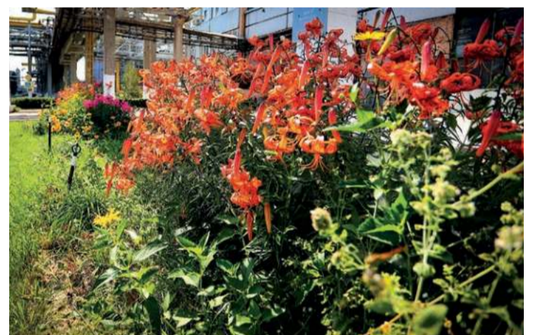
Культура труда начинается с эстетики, считают в цехе №27. Особое настроение здесь создают ослепительные лилии.