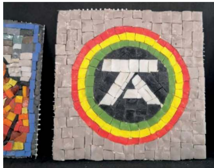
Одна из работ центра мозаики – логотип Тольяттиазота, выполненный из цветного стекла