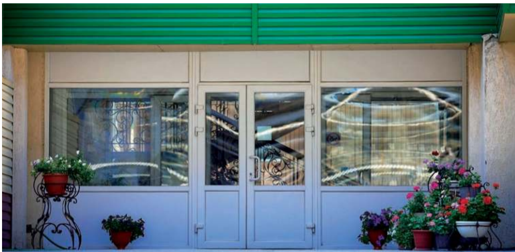
Кованые кашпо, наполненные цветами, у входа в административно-бытовой корпус – «визитная карточка» агрегата аммиака №6.