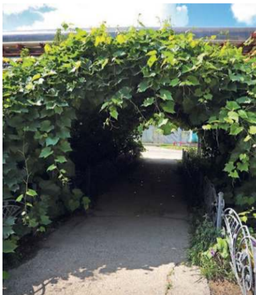
Возле цеха №10 раскинулся... виноградник. Коллектив заботится о нём уже много лет и гордится урожаем.