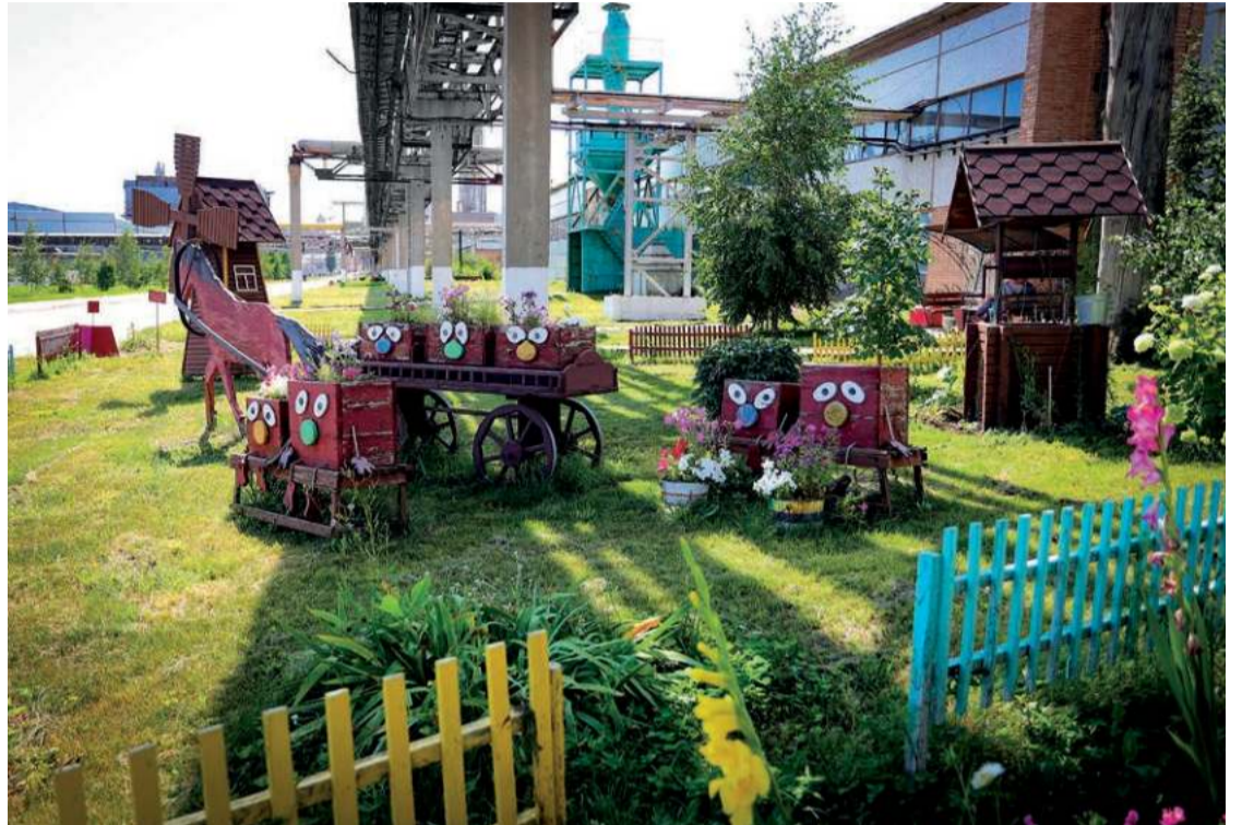
В общестроительном цехе знают, как дать вторую жизнь материалам. Эта ландшафтная композиция – дело рук умельцев со столярного участка.