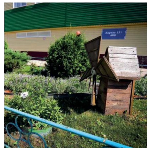
Хвойные деревья возле корпуса №121 оживляют промышленный пейзаж.

«Волжский химик» УЧРЕДИТЕЛЬ ГАЗЕТЫ – ПАО «ТООЗ»