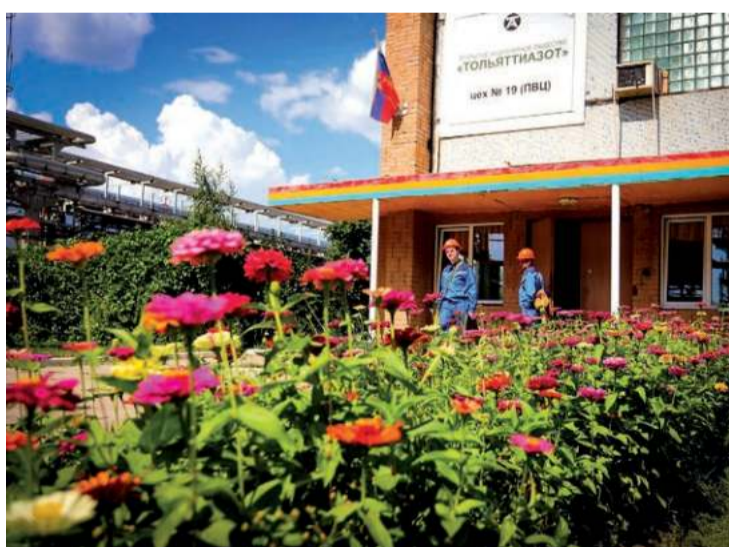
Разноцветными герберами встречает клумба возле цеха тепловодоснабжения и канализации (№19).